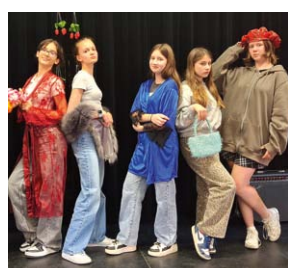
Glamour, Frust und Hühneraugen

18.30 Glamour, Frust & Hühneraugen von Judith Weidl PREMIERE Eine Inszenierung des TheaterJugendClubs