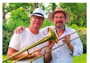
Langsam wächst der grüne Daumen